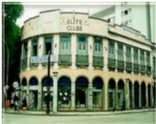
Figura 14 – Fachada do Elite Clube, um edifício do século 19, no Centro do Rio. 9