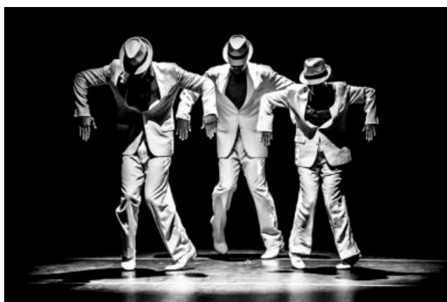
Figuras 20 e 21 - Espetáculo Gaffe, Cia Aérea de Dança (Fonte: Livro Noites Cariocas, PERNA, 2020, p. 70)

Antes de partir para o próximo tópico, destacaremos o fato de Maria Antonietta ser homenageada nos dois ambientes de dança citados acima. Isso já nos dá indícios do prestígio da mestra do meio das danças a dois, mas iremos entrar de forma mais aprofundada no assunto nos próximos capítulos.