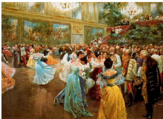
Figura 8 – Baile da corte em Viena (Wilhem Gause, 1900) 1

Surgida na Europa Renascentista, a dança de salão sempre foi muito apreciada, quer entre a plebe, quer entre os nobres. Identifica-se que esta dança chega ao Brasil no século XVI trazida pelos portugueses, sofrendo atualizações a partir da imigração de outras nacionalidades europeias vindas para o Brasil. Diferente do que conhecemos hoje, essas primeiras danças eram de salão, mas não a dois de pares enlaçados. As danças de corte, como a gavota e o minueto, ainda não eram danças de pares enlaçados, mas se caracterizavam por serem dançadas em pares, tendo troca e interação entre outros casais. (PERNA, 2001)