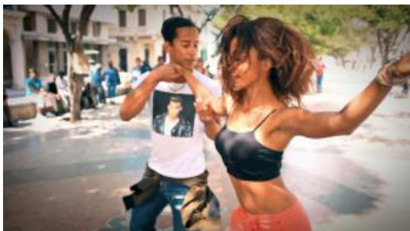
Figura 5 – Casal dançando salsa

A Salsa surgiu na Ilha de Cuba, mais propriamente em Havana, na década de 40. O nome “salsa”, em sua origem, quer dizer “tempero” ou “mistura”. A salsa tem em sua musicalidade básica o son cubano, o mambo, a rumba, a bomba, a plena, o samba brasileiro, o rock, o reggae, entre outros diversos ritmos que foram “apimentando” a dança. Além da salsa dançada a dois, a salsa também pode ser dançada em roda com diversos casais, a chamada roda de cassino. Nesta os casais executam os pedidos do “cassineiro”, envolvendo movimentos típicos da dança, trocando seus pares e realizando diversas brincadeiras. (SANTANA, 2009)