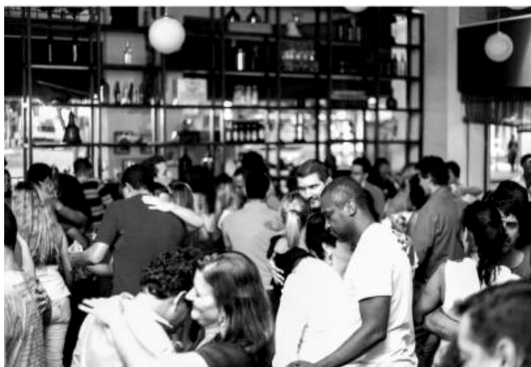
Figura 12 - Baile de Forró no Bar Gaspar, na Praça Tiradentes, em 2013.

A partir dos aspectos práticos citados no início deste capítulo como uma tentativa de definir em arestas o que seria a dança de salão, e a forma como foi se dando a trajetória desta dança na cidade do Rio de Janeiro, fica claro que a dança de salão se relaciona diretamente com os locais onde ela se apresenta, sendo muito mais do que modalidades de danças e sequências de movimentos. A dança de salão possui grande valor cultural, e suas dinâmicas refletem aspectos da vida social. Veremos a seguir que todas essas dinâmicas convergem para um objetivo comum: o baile. Podemos entender o baile como o ápice das diferentes linhas práticas que a dança de salão se envolve, tanto no passado como na atualidade. É no baile que o ato de dançar a dois, em toda a sua complexidade, se concretiza.