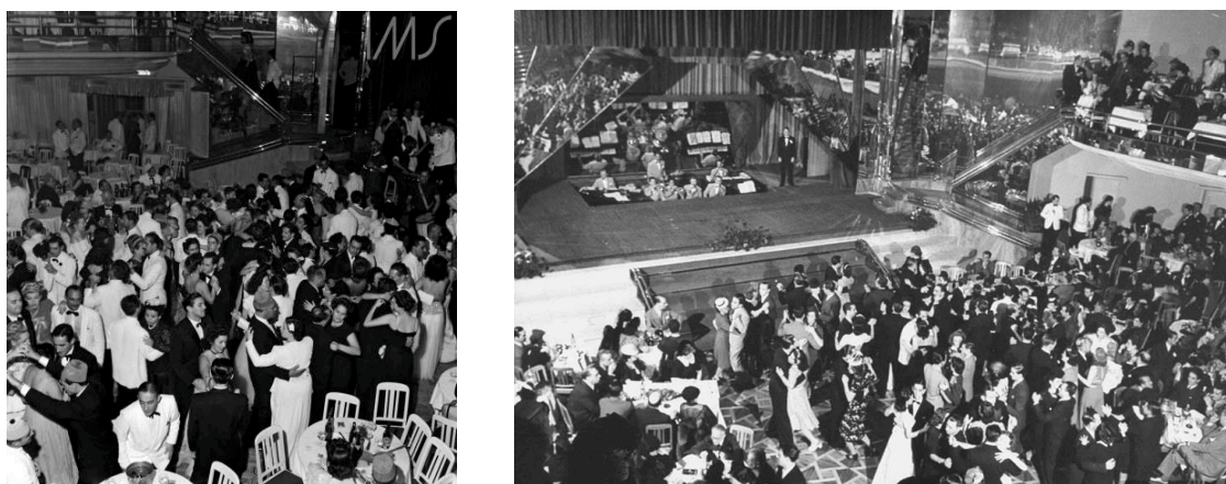
Figuras 9 e 10 – Cassino da Urca (anos 1930) 3

Nunca se dançou tanto no Rio como nos anos 40. Ao som de orquestra, ou de pequenos grupos, ou de discos de 78 rotações, dançava-se em clubes, em gafieiras, em cabarés ou em casas de família, onde bastava afastar a mesa da sala para que se abrisse espaço aos pés-de-valsa. Que não eram apenas de valsa, mas de fox americano, bolero mexicano e baião brasileiro. O samba, na época, era a quarta opção dos dançarinos. Em toda formatura, o baile era obrigatório. Em festa de debutante, também. No réveillon, dançar era obrigatório. Estima-se que, na época, o Rio tivesse cerca de 500 gafieiras 2 . A febre da dança iria desaparecer, aos poucos, na década seguinte. (Jornal ‘O Globo’, 2017)