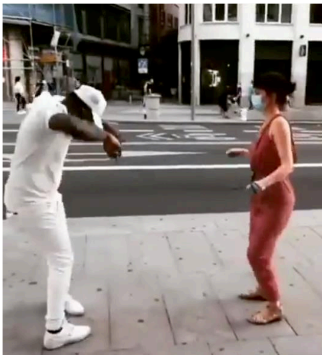
Figura 36 – Casal dançando com cordas na mão para manter um distancia considerada segura durante a dança 36 .

dançar presencialmente sem desrespeitar as regras, dançando com cabo de vassouras e cordas (Figura 36), e até desenvolvendo formas de praticar a dança individualmente.