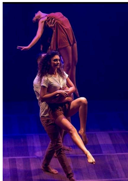
Figura 22 - Espetáculo Quem somos nós, da Cia. de Dança CCC / Figura 23 – Espetáculo Bendito Samba, da KVS Cia. de Dança

No setor do ensino da dança de salão, também ao longo dos anos, tem se fortalecido um modelo de aulas conhecido como “congressos” de dança, ou workshops . Os congressos se caracterizam por serem eventos de pouca durabilidade, geralmente um final de semana, onde são realizadas aulas específicas de determinada dança (bolero, samba de gafieira, danças americanas, entre outras) com professores que são referência no assunto. Diferentemente das aulas em academias, que possuem uma continuidade, as aulas dos congressos ou workshops são pontuais, com o intuito de agregar um conteúdo diferenciado ao repertório do participante.