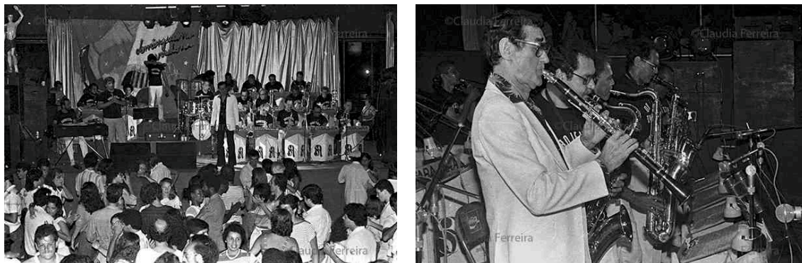
Figura 18 e 19 – Circo Voador (Domingueira Voadora) 14

em 1982 e durou 15 anos. O baile atraía um público que “batia ponto” no Circo toda semana, tornando-se a principal vitrine para os dançarinos e professores da época.