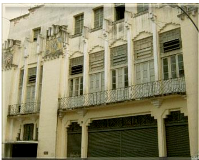
Figura 16 – Fachada da sede do Clube dos Democráticos, construído nos anos 1930, na Lapa 12 .

Terras de Santa Maria (7), na Zona Norte, a Gafieira Elite (10), no Centro, e o Clube Monte Líbano (15), na Zona Sul. Espaços importantes para a história da dança de salão no Rio de Janeiro, como é o caso do Circo Voador (11), davam mais espaço apenas para eventos específicos de forró, por exemplo. E, ainda, espaços que tiveram suas portas fechadas por dificuldades financeiras (PERNA, 2001), como é o caso do Grêmio Recreativo Vera Cruz (2), que encerrou suas atividades em 2009, o Clube Sírio e Libanês (13), não foi encontrado ao certo o ano de seu fechamento, e a Estudantina Musical, que decretou o seu fim em 2018.