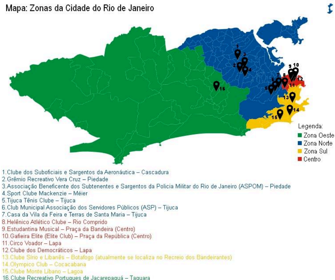
Figura 15 – Mapa mostrando onde se concentravam os bailes na cidade do Rio de Janeiro (1960-1970)

Apesar dos clubes sociais terem atingido seu auge na década de 1960, pelos mesmos motivos das gafieiras, agravados ainda pelo surgimento das academias e expansão imobiliária da cidade, os clubes sociais também decretaram o seu fim. As academias, hoje espalhadas em todo o Rio de Janeiro, viram a oportunidade de utilizar o espaço da sala de aula como salão de baile e, também, uma forma de fazer um