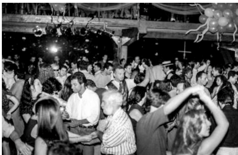
Figura 13 - Baile do Centro de Dança Jaime Arôxa, na Casa de Espanha (1997).

pares durante a dança no sentido anti-horário). Bebidas alcoólicas são raras nas mesas, sendo mais frequente o consumo de água ou refrigerantes, alguns para não comprometer o equilíbrio, outros para manter o baixo custo do entretenimento. E o ambiente sempre alegre alimenta o corpo e a alma de quem vai a um baile de dança de salão.