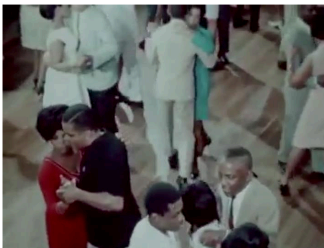
Figura 11 – Baile no Gafieira Elite, em 1972 4 .